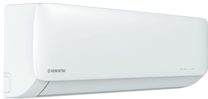
Внутренний блок KSGA53HZRN1